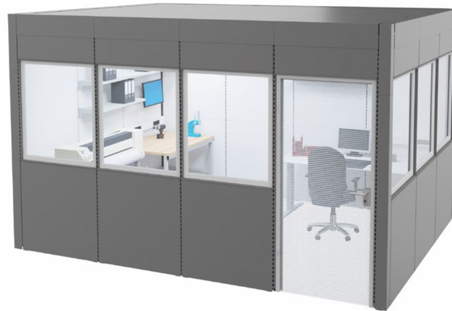
Cabine acoustique fermée, par exemple comme bureau