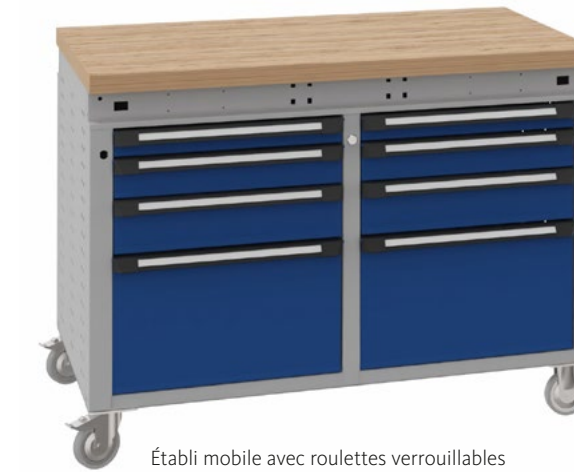
Établi mobile avec roulettes verrouillables et combinaison de tiroirs

Que ce soit dans un atelier, un entrepôt ou une entreprise de fabrication, les établis OTTOKIND sont faits pour les professionnels. Ils sont de grande qualité, robustes et pratiquement inusables, et donc parfaitement adaptés à une utilisation dans le quotidien exigeant de l'entreprise. Les différents types d'établis peuvent être configurés avec des tiroirs, des structures portantes de système et des parois fonctionnelles en fonction de vos propres besoins. On obtient ainsi des postes de travail parfaitement équipés et organisés de manière optimale, qui garantissent des processus de travail idéaux et une productivité accrue.