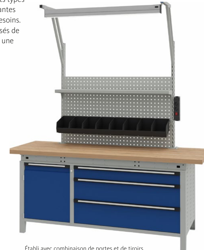
Établi avec combinaison de portes et de tiroirs et structure système avec éclairage LED