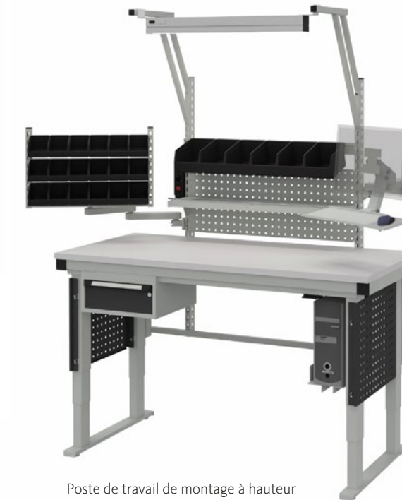
Poste de travail de montage à hauteur réglable électriquement