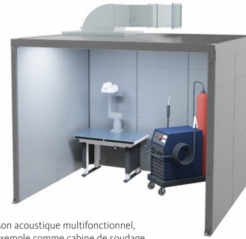
Caisson acoustique multifonctionnel, par exemple comme cabine de soudage

Dans les environnements de travail avec un environnement bruyant permanent, une insonorisation efficace permet de gagner en concentration, en précision et en efficacité. Les systèmes acoustiques d'OTTOKIND réduisent considérablement les nuisances sonores. Ils contribuent à la prévention des risques pour la santé et évitent des arrêts de production coûteux. Grâce à leur conception modulaire, nos solutions « cabine fermée modulaire dans l'atelier » et nos parois antibruit peuvent être utilisées dans presque toutes les configurations. Pour un calme bienfaisant, une atmosphère de travail agréable et des collaborateurs satisfaits.