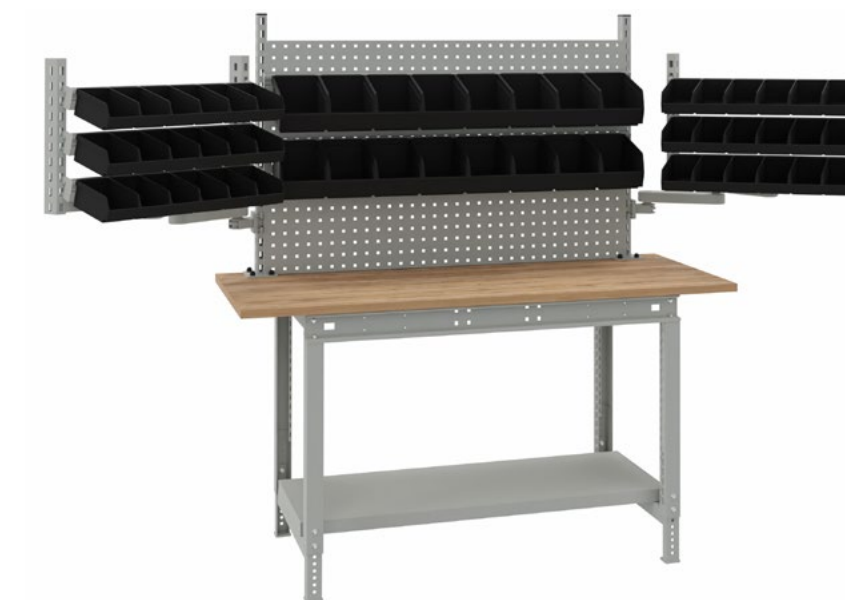
Établi avec structure et étagère