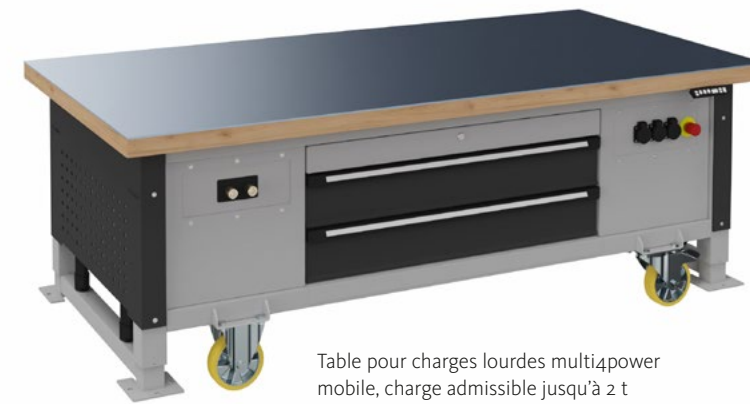
Table pour charges lourdes multi4power mobile, charge admissible jusqu'à 2 t

Qu'il s'agisse de postes de travail pour des tâches légères d'emballage ou de tables pour charges lourdes pour des charges extrêmes jusqu'à 2 tonnes. Avec beaucoup d'espace de rangement ou avec des éléments fonctionnels. OTTOKIND propose pour chaque exigence une solution de poste de travail hautement fonctionnelle et ergonomique qui peut être configurée individuellement. Bien entendu, avec un réglage électrique de la hauteur pour un confort maximal. Les systèmes de postes de travail d'OTTOKIND permettent d'optimiser les processus de travail et d'améliorer la santé et les performances des collaborateurs. Le résultat : des temps d'arrêt réduits, une productivité accrue et une flexibilité maximale.