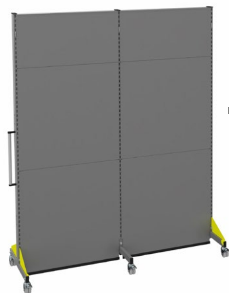
Paroi mobile acoustique