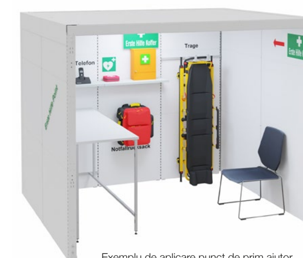
Exemplu de aplicare punct de prim ajutor