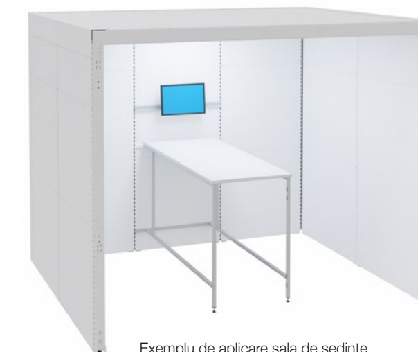
Exemplu de aplicare sala de ședințe