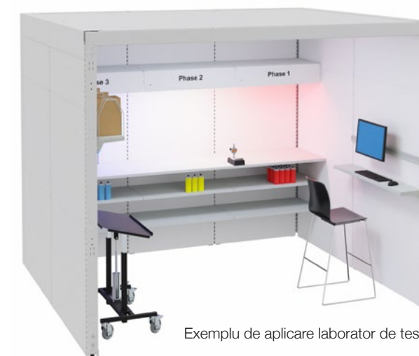
Exemplu de aplicare laborator de testare