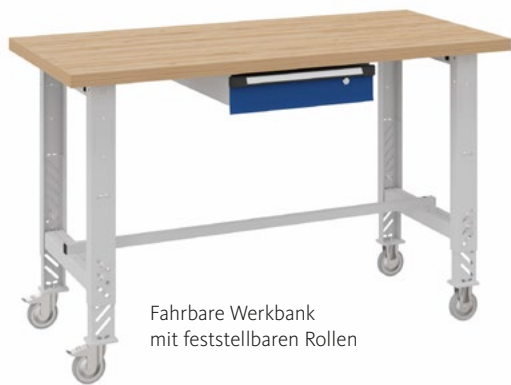
Fahrbare Werkbank mit feststellbaren Rollen

Ob in Werkstatt, Lager oder Produktionsbetrieb – die OTTOKIND Werkbänke sind für Profis gemacht. Sie sind hochwertig, robust und nahezu verschleißfrei und damit für den Einsatz im rauen Betriebsalltag bestens geeignet. Die unterschiedlichen Werkbank-Typen lassen sich mit Schubladen, Systemaufbauten und Funktionswänden nach eigenen Bedürfnissen konfigurieren. So entstehen perfekt ausgestattete und optimal organisierte Arbeitsplätze, die für ideale Arbeitsabläufe und höhere Produktivität sorgen.