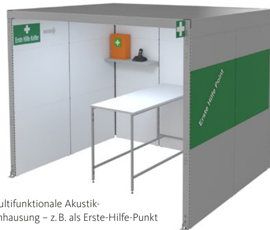
Multifunktionale Akustik-Einhausung – z. B. als Erste-Hilfe-Punkt

In Arbeitsumgebungen mit einer dauerhaften Geräuschkulisse sorgt effektiver Schallschutz für mehr Konzentration, Präzision und Effizienz. Akustiksysteme von OTTOKIND reduzieren Lärmbelastungen deutlich. Sie tragen zur Prävention gesundheitlicher Risiken bei und vermeiden kostenintensive Produktionsausfälle. Unsere Raum-in-Raum-Lösungen und Lärmschutzwände sind durch den modularen Aufbau in nahezu jeder Raumsituation einsetzbar. Für wohltuende Ruhe, eine angenehme Arbeitsatmosphäre und zufriedene Mitarbeitende.