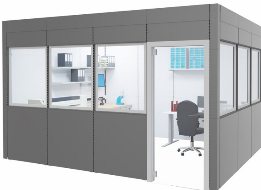
Geschlossene Akustik-Kabine z. B. als Büro