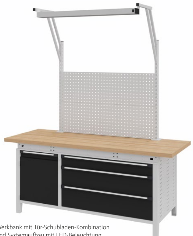
Werkbank mit Tür-Schubladen-Kombination und Systemaufbau mit LED-Beleuchtung