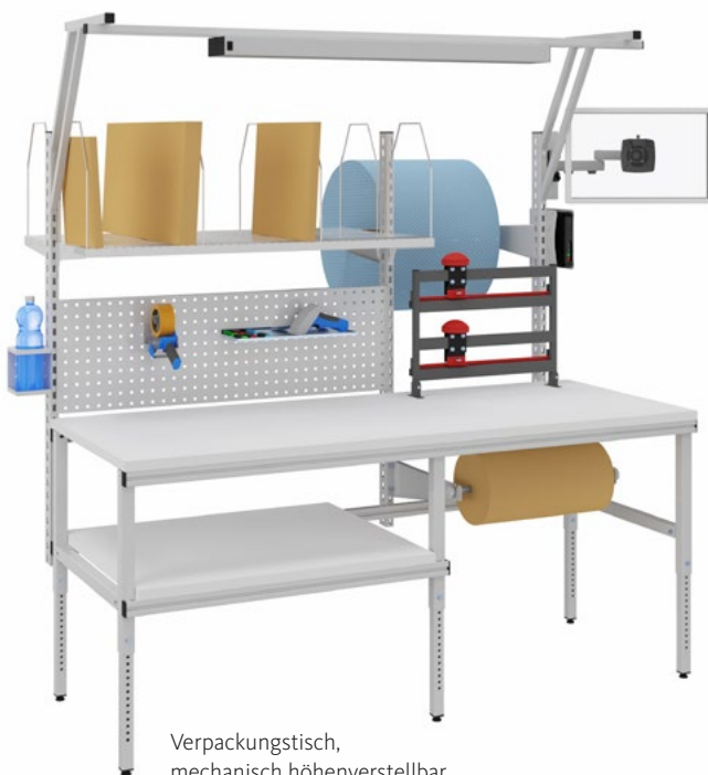
Verpackungstisch, mechanisch höhenverstellbar