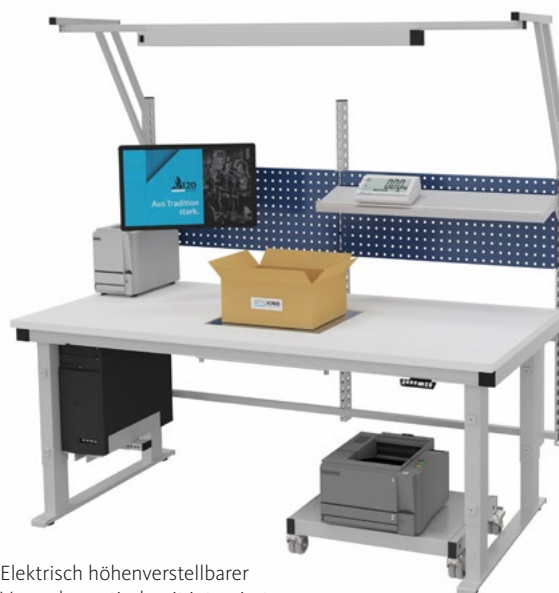
Elektrisch höhenverstellbarer Verpackungstisch mit integrierter Waage, Systemaufbau und Druckerwagen